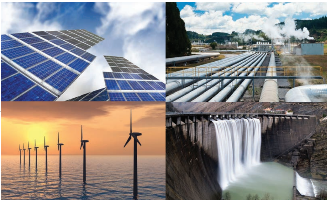
L'objectif est de positionner la France comme un acteur majeur des technologies de production d'énergies renouvelables.

incitations à l'équipement, fonds chaleur, appels d'offres nationaux...) a été élaboré en 2008 et des objectifs de puissance installée, définis au titre de la Programmation pluriannuelle des investissements (PPI). Pour le ministère de l'Écologie, du Développement durable, des Transports et du Logement, l'objectif est de positionner la France comme un acteur majeur des technologies de production d'énergies renouvelables,