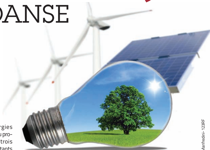
De nouvelles énergies aux potentiels inépuisables.